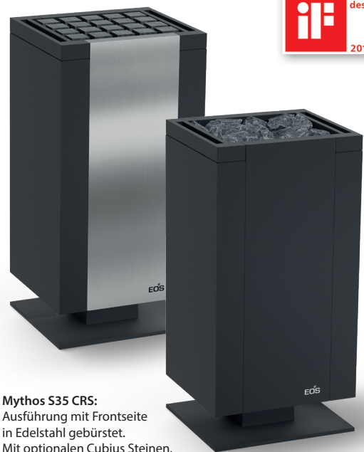
Mythos S35 CRS: Ausführung mit Frontseite in Edelstahl gebürstet. Mit optionalen Cubius Steinen.