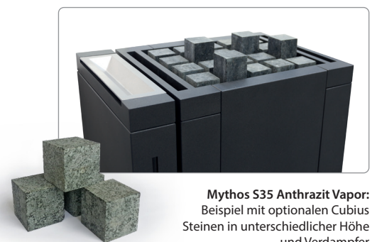
Mythos S35 Anthrazit Vapor: Beispiel mit optionalen Cubius Steinen in unterschiedlicher Höhe und Verdampfer